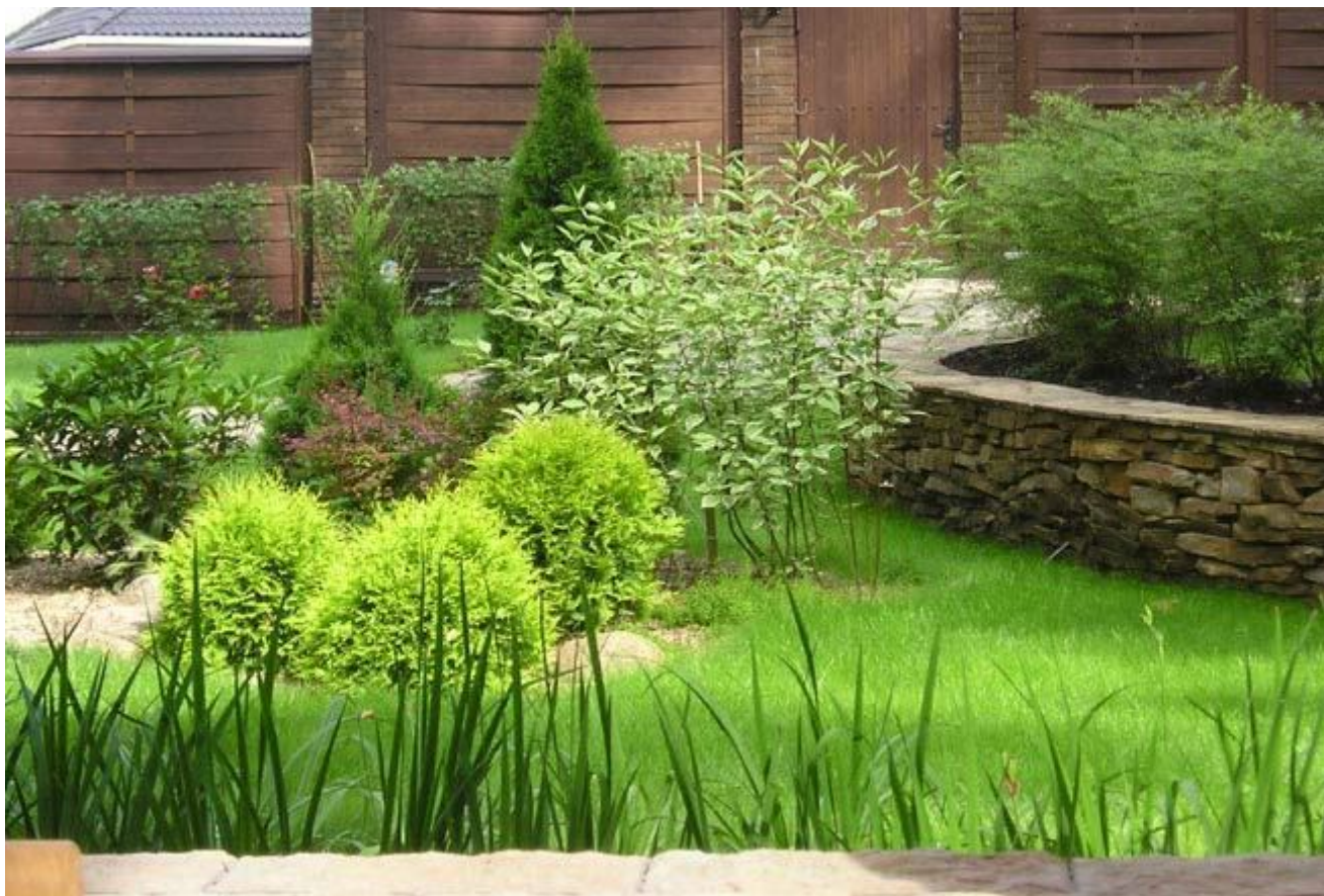
- Газонные ограждения, декоративные ограждения для клумб.