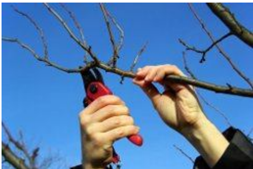
- Уборка сухостойных деревьев.